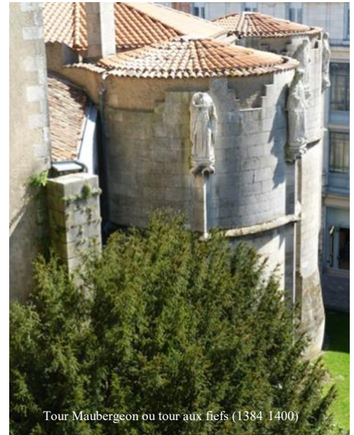
Tour Maubergeon ou tour aux fiefs (1384 1400)

Le contexte politique et culturel a maintenu un haut niveau de création artistique au XV e siècle, et même bien au-delà malgré la perte de pouvoir économique et politique, mais le nombre des édifices médiévaux impose de faire une sélection. On ne saurait passer sous silence l'actualité archéologique ou monumentale, ainsi les mises au jour de peintures murales dans la cathédrale, ou les projets concernant le palais – continûment lieu de justice jusqu'à 2019.