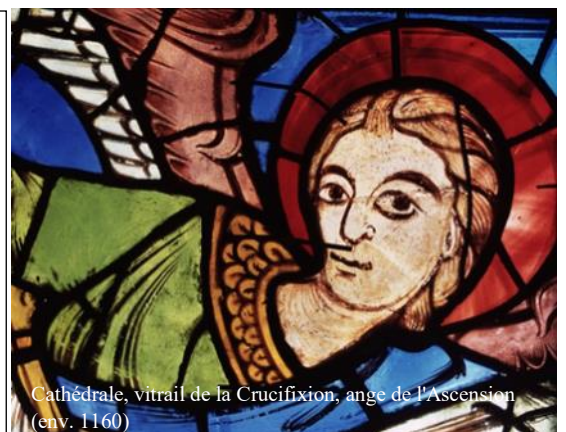
Cathédrale, vitrail de la Crucifixion, ange de l'Ascension (env. 1160)

Fin des visites à l'église des Jésuites (chapelle Saint-Louis de Poitiers, 1 rue Louis Renard, à environ 900 m de la gare SNCF) le dimanche 27 mars aux alentours de 17h.