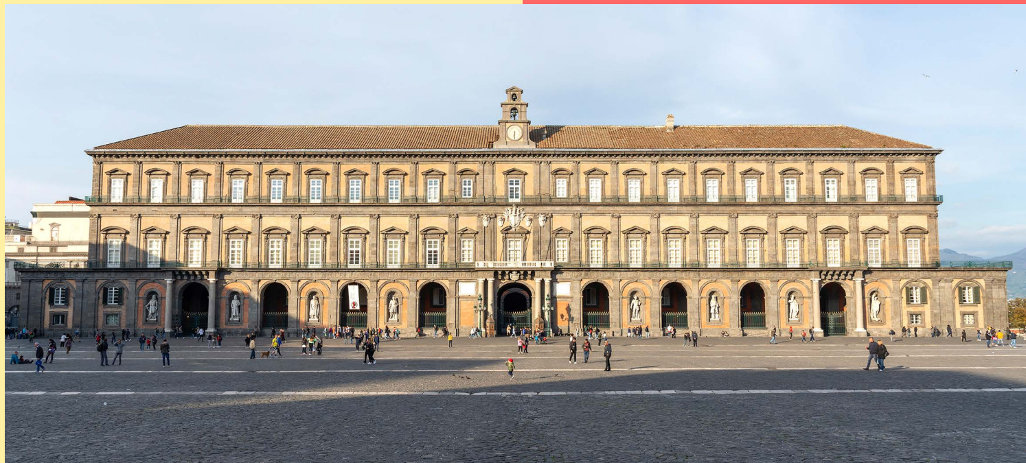
Naples, Palais royal.

Après-midi : Vol retour de Naples à Paris