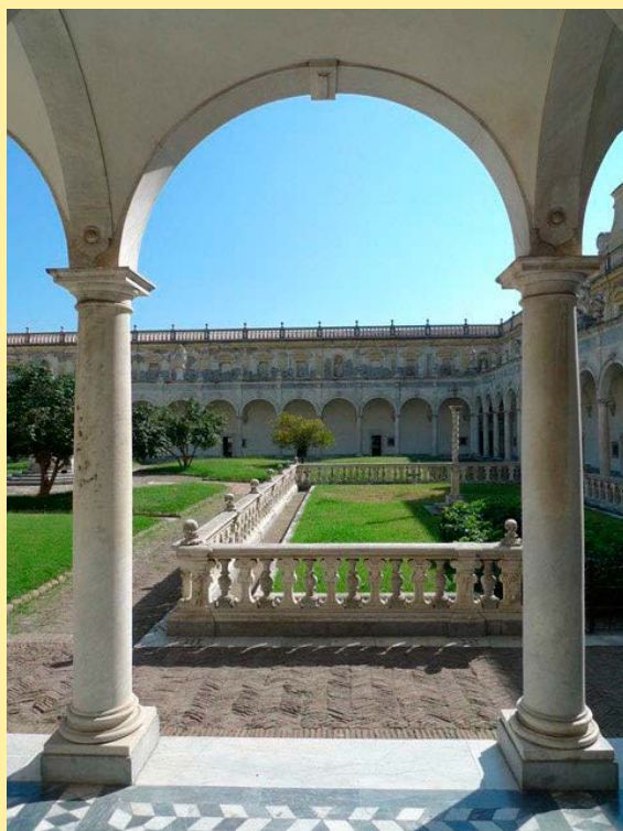
Naples, chartreuse San Martino, cloître.

Trop longtemps négligé par les pouvoirs politiques voire offensé par la spéculation, le patrimoine artistique de la ville jouit depuis les dernières décennies d'une nouvelle attention de la part du tourisme international. Naples est redevenue une étape obligée du Grand Tour.