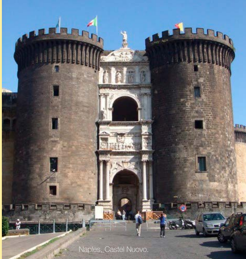
Naples, Castel Nuovo.