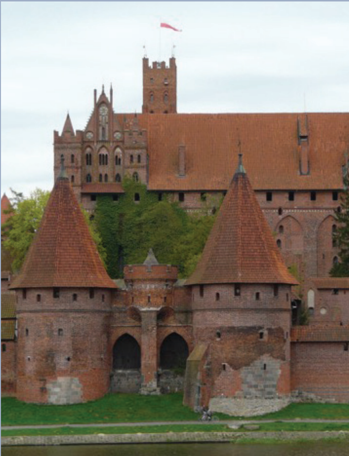
Château de Malbörk