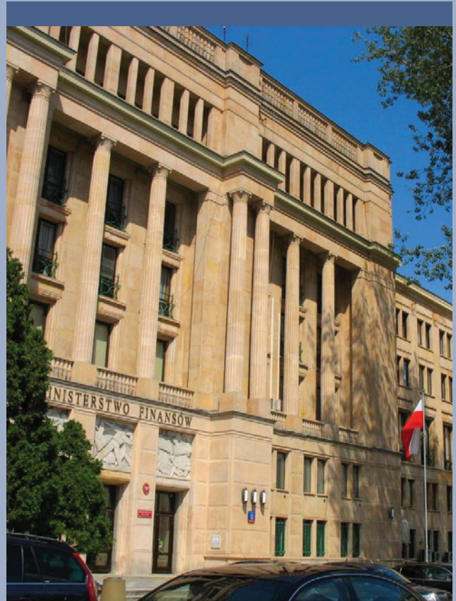
Ministère des finances de Varsovie