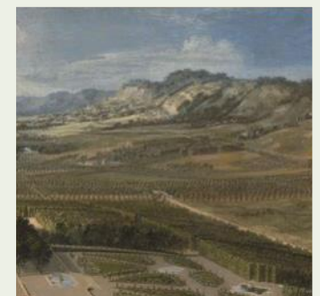
Pierre PATEL, Vue du château et des jardins de Versailles, prise de l'avenue de Paris . 1668 (ill Maroteaux MV 765 Patel - @jm Mana+)